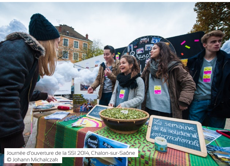
Journée d'ouverture de la SSI 2014, Chalon-sur-Saône

En novembre dernier, à la veille du lancement de la 18 ème édition de la SSI, les attentats avaient lieu à Paris. Malgré le choc, les acteurs de la SSI ont souhaité organiser, dans la mesure du possible, leurs événements, afin de porter haut et fort ce message de solidarité qu'ils incarnent au quotidien.