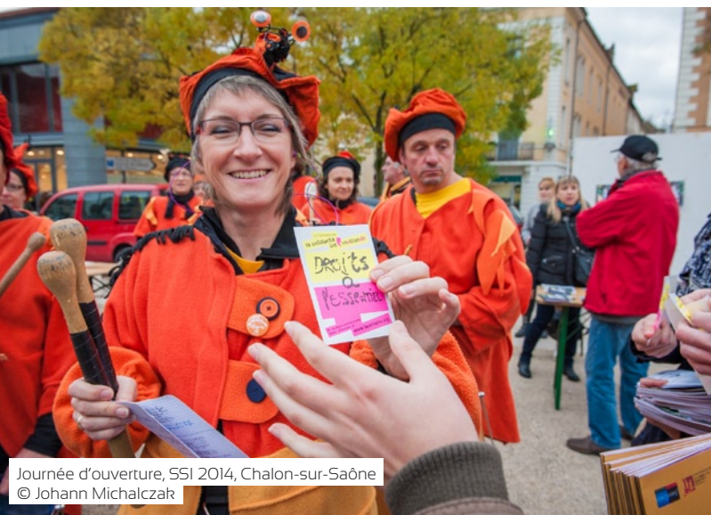
Journée d'ouverture, SSI 2014, Chalon-sur-Saône

Depuis maintenant 19 ans, pendant la troisième semaine de novembre, la Semaine de la Solidarité Internationale (SSI) rassemble ceux qui agissent et ceux qui souhaitent s'informer, échanger et prendre part à la construction d'un monde plus solidaire.