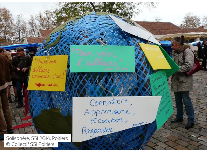
Solisphère, SSI 2014, Poitiers

La SSI est un temps fort dédié aux droits de chacun, partout dans le monde, qui permet de rappeler l'importance de la lutte quotidienne pour plus d'égalité entre les peuples. Cette volonté de faire respecter les droits humains s'incarne aujourd'hui dans les Objectifs du Développement Durable (ODD) de l'ONU. Alors que les Objectifs du Millénaire pour le Développement (OMD) concernaient seulement les pays en développement, les ODD rappellent que tous les Etats sont concernés.