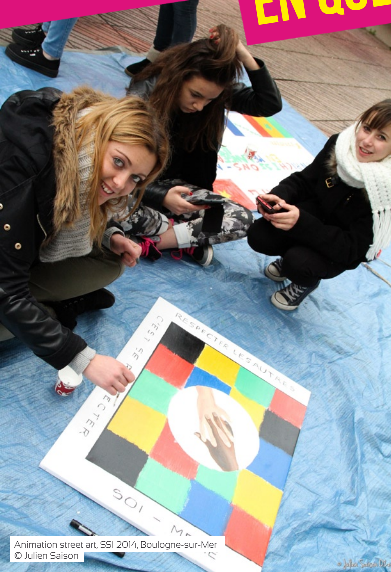
Animation street art, SSI 2014, Boulogne-sur-Mer