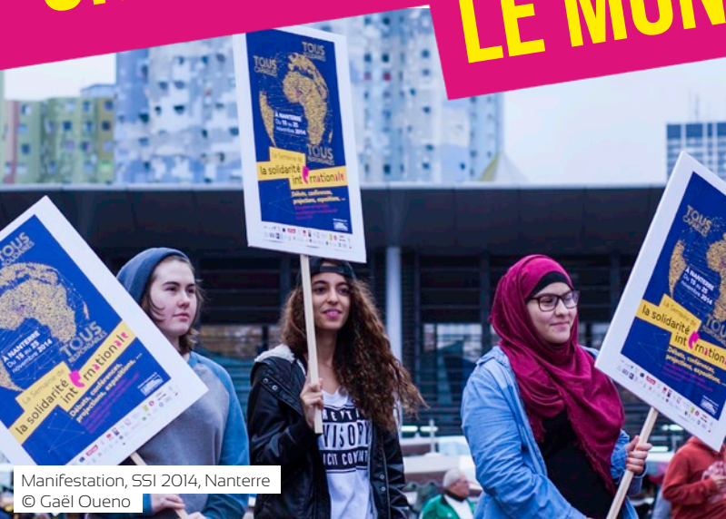
Manifestation, SSI 2014, Nanterre