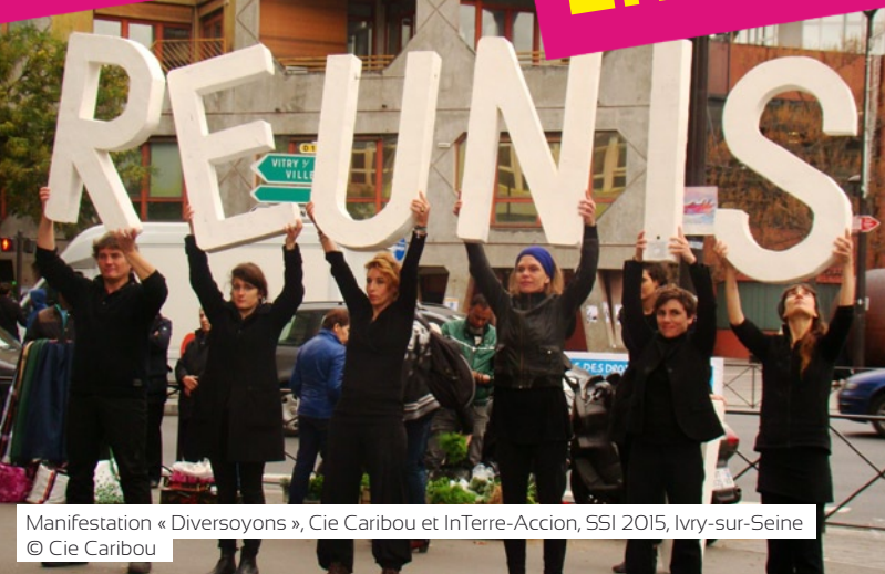
Manifestation « Diversoyons », Cie Caribou et InTerre-Accion, SSI 2015, Ivry-sur-Seine