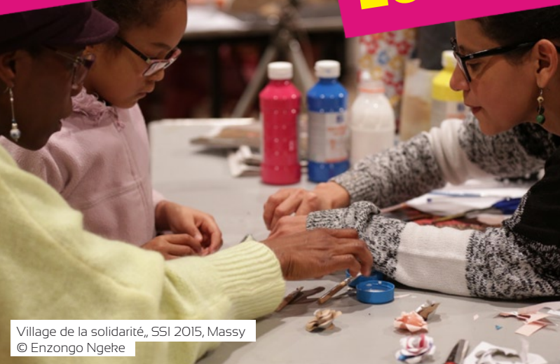
Village de la solidarité, SSI 2015, Massy