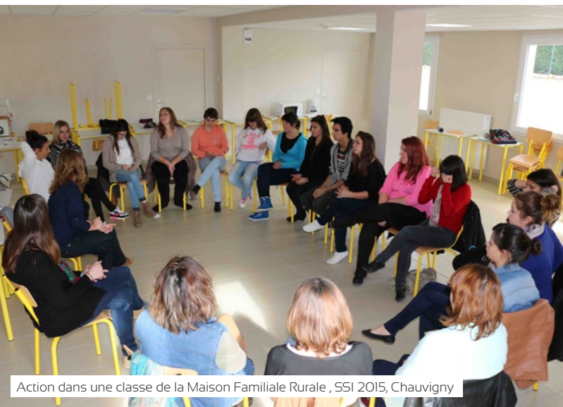
Action dans une classe de la Maison Familiale Rurale, SSI 2015, Chauvigny