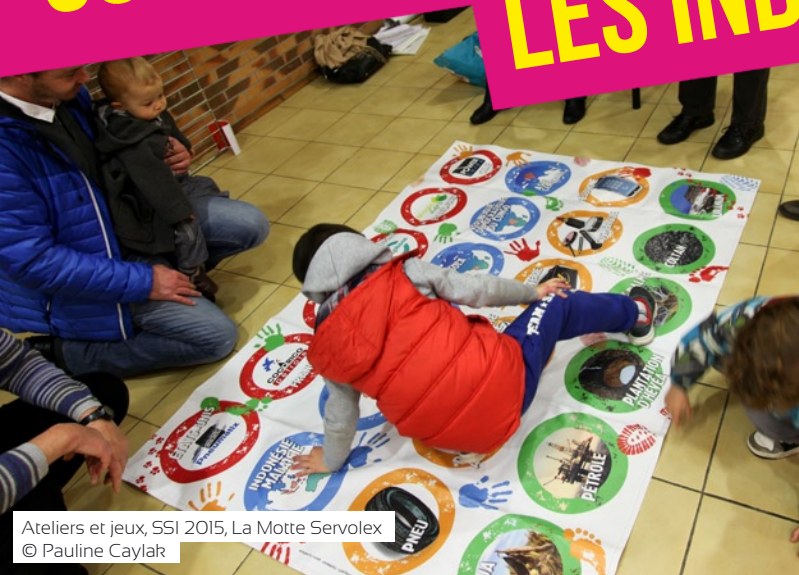
Ateliers et jeux, SSI 2015, La Motte Servolex